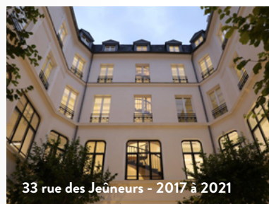
33 rue des Jeûneurs - 2017 à 2021