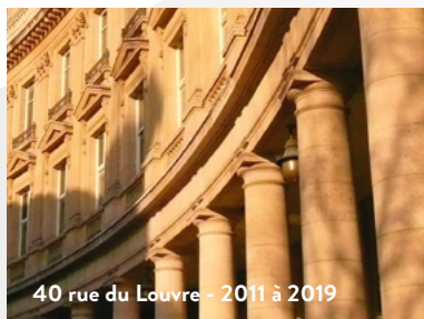
40 rue du Louvre - 2011 à 2019