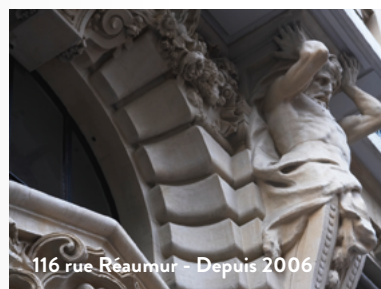
116 rue Réaumur - Depuis 2006