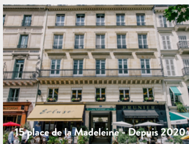
15 place de la Madeleine - Depuis 2020