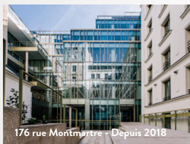
176 rue Montmartre - Depuis 2018