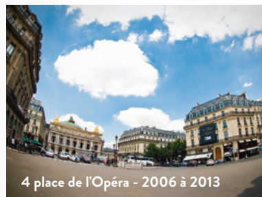
4 place de l'Opéra - 2006 à 2013